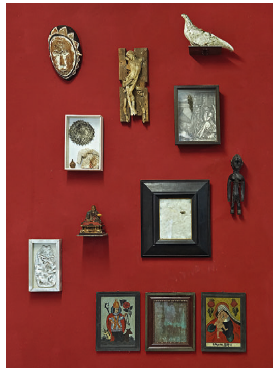
Hubertus Hess Sammlung 2015

19 Künstlerinnen und Künstler positionieren sich in ganz un- terschiedlichen Darstellungsweisen in Plastik, Skulptur, Zeichnung,