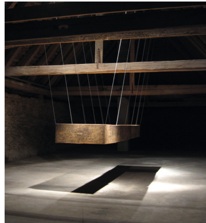
Meide Büdel Installation „Große Schwebel“ Stahl

„Gott und die Welt“: Es ist ein Thema, das zum Diskurs heraus- fordert. Künstlerische Haltungen werden dazu Stellung nehmen, Fragen aufwerfen und einen sinnlich anregenden Denkraum entstehen lassen.