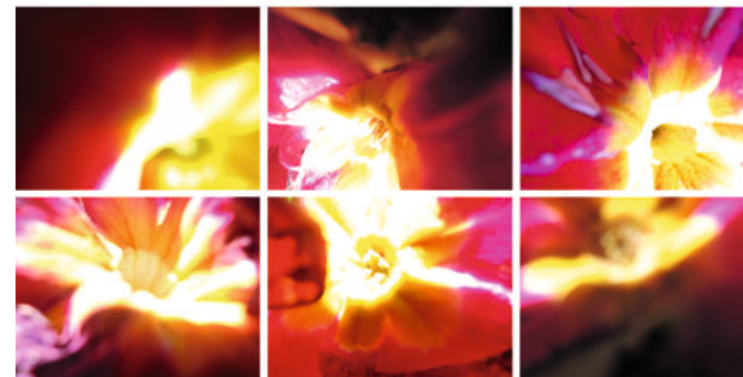
Gerhard Mayer ▶ Wandzeichnung